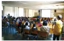
良い映画を見る会(児童対象映画会)の様子

その他、ボランティアグループの活動記録の撮影、郷土に根ざした作品作りを行うなどして、県のコンクールにも県知事賞をはじめ、多数入賞をしています。